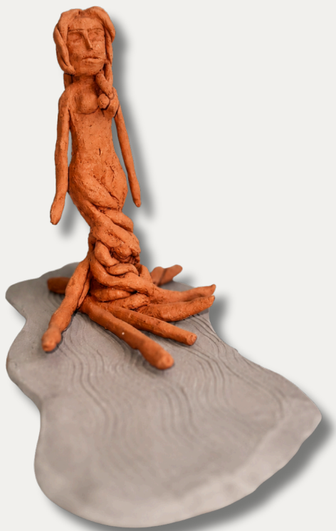
Γυναικεία μορφή με ρίζες δέντρου