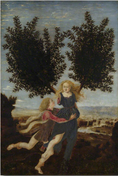
Απόλλωνας και Δάφνη. Pollaiuolo, Antonio del, περίπου 1470-1480, λάδι σε μουσαμά. Λονδίνο, National Gallery

Ο θεός Απόλλωνας, γυρνώντας από τη σφαγή του τέρατος Πύθωνα, συνάντησε τον θεό Έρωτα, τον οποίο περιγέλασε για το μικρό του σώμα και τα βέλη του.